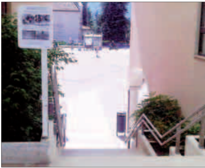
L'accesso alla piazza e il cartello posizionato da Stefani

Per questo Stefani ha deciso di «richiamare» pubblicamente chi insozza la piazza, «calpestando» il lavoro di tanti volontari, affiggendo alcuni cartelli sulle scale che portano al centro civico. «Questo luogo viene pulito tre volte in settimana - si legge - due volte da gruppi di cittadini volenterosi e una volta dagli operatori di Dolomiti Energia. Nonostante ciò è spesso sporco perché dei maiali (ci perdono questo genere animale) ci stazionano senza nessun senso civile, vanificando il lavoro e la disponibilità dei nostri cittadini più disponibili. Tutto ciò non è più sopportabile. Educhiamo questi ragazzi. Segnaliamo questo comportamento». Da quando il cartello è stato messo - tre settimane fa - le cose sono migliorate, ma il sospetto è che i responsabili siano proprio quei bulletti che spadroneggiano a Cognola da qualche mese. F.P.