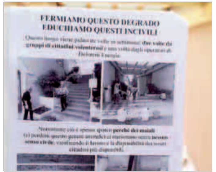
L'appello a fermare queste azioni incivili