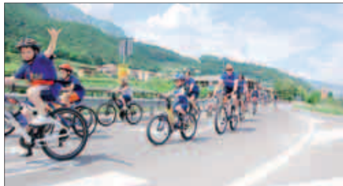
Alcuni partecipanti alla pedalata di «protesta»

Ravina e Romagnano: due paesi ed una circoscrizione. A collegarli (o a dividerli, in questo caso) la sp 90, la provinciale che in quel tratto manca di marciapiede ed illuminazione, accanto alla quale ormai da quasi dieci anni si parla della realizzazione di una pista ciclabile, ora inserita anche nel Pum ma più volte slittata nell'agenda politica. Un'opera che contribuirebbe non poco a legare i due paesi: lo hanno dimostrato ieri un centinaio di cittadini, giovani e meno, famiglie, bambini, che hanno inforcato la bicicletta per il «Diritto alla meta», questo lo slogan della manifestazione per chiedere in maniera pacifica ed alternativa la tanto attesa pista ciclabile sulla Destra Adige. Un'iniziativa promossa ed annunciata tempo fa dalla Circoscrizione e poi «adottata» dal circolo Le Fontane che ha accolto i ciclo-manifestanti offrendo un tè freddo all'arrivo nella piazza di Romagnano, dove è